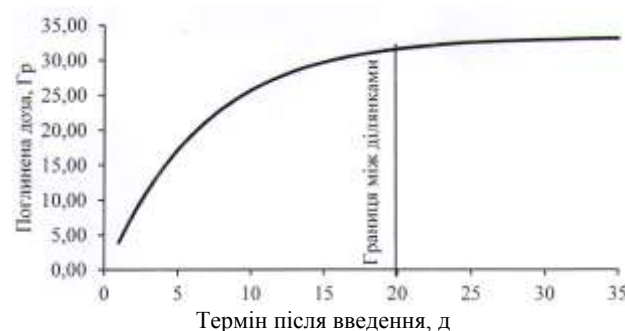
Рис. 1. Динаміка формування дози в ЩЗ шура за одноразового надходження 114800 Бк 131 I.

виразу t = 1,51 \cdot \ln(Q) + 2,68 за Q \geq 1800 Бк та t = 14 діб за Q < 1800 Бк.