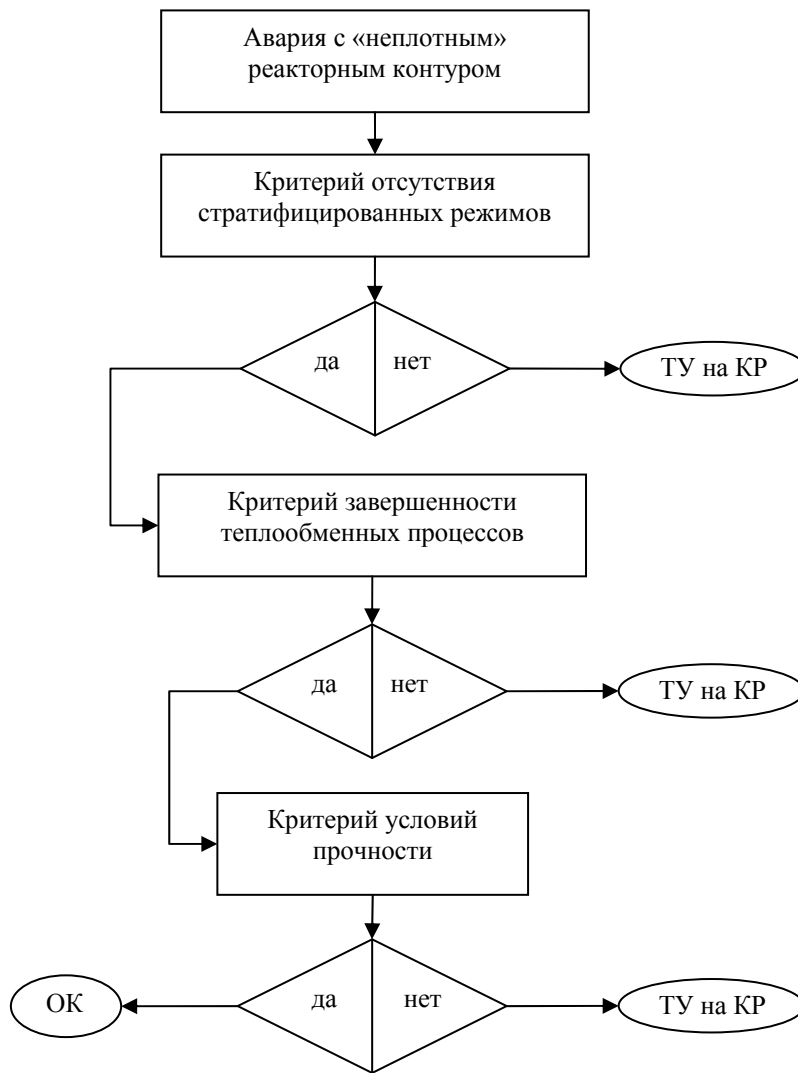
Рис. 3. Критериальный метод оценки условий термоудара на корпус реактора при авариях с «неплотным» реакторным контуром.

Предложенный подход позволяет сформулировать критериальный метод для оценки условий возникновения термоудара на корпус реактора (рис. 3), в котором консервативно предполагается, что термоудар на корпус реактора однозначно происходит при следующих обстоятельствах: