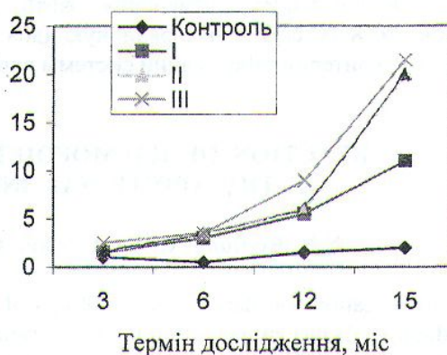
Рис. 2. Кількість патологічних лімфоцитів у тварин, які постійно знаходились у Чорнобилі при трьох радіаційних навантаженнях.